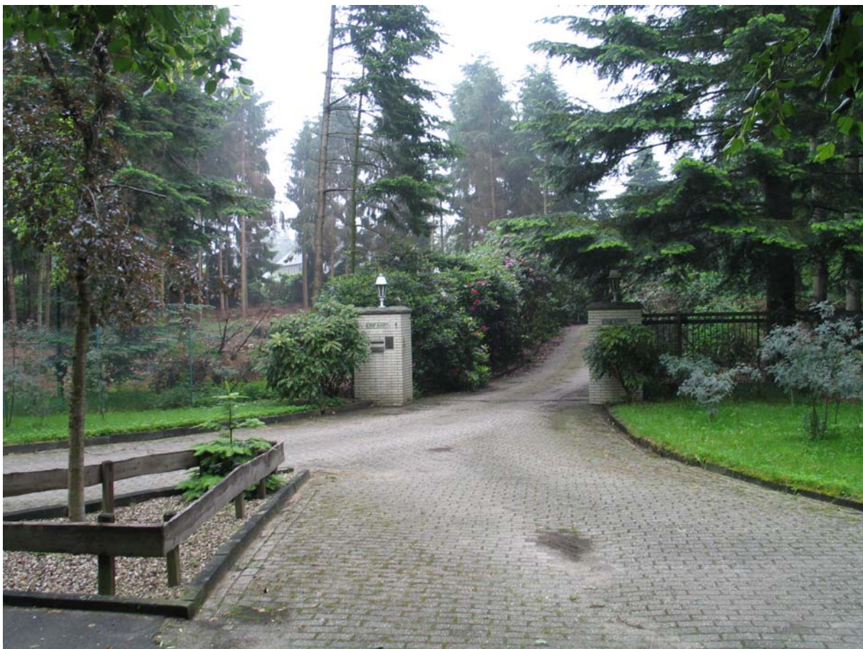
Die Auffahrt mit dem Landhaus im Hintergrund