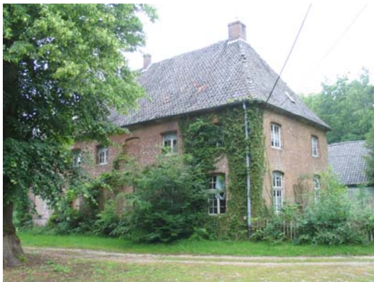
Die alte Oberförsterei