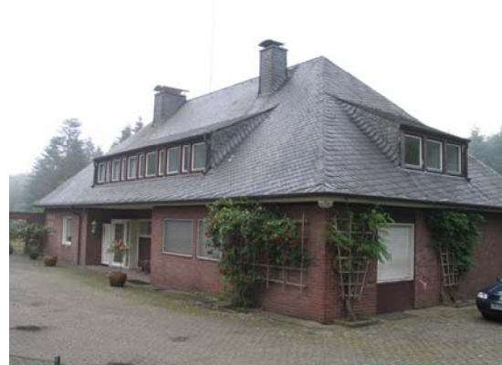
Das Haus vom Vorplatz aus