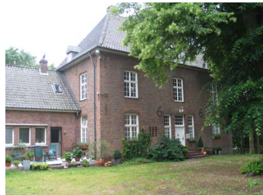
Das alte Pastorat